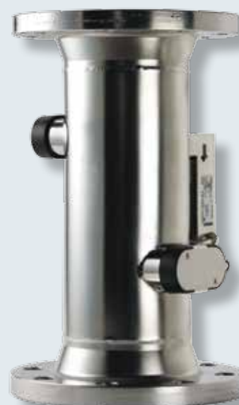
Průtokové snímače ULTRAFLOW® qp 60 až 1.000 m 3 /h