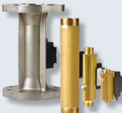
Průtokové snímače ULTRAFLOW® qp 0,6 až 40 m 3 /h